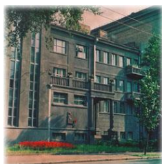
ІНСТИТУТ БІОХІМІЇ ІМ. О.В. ПАЛЛАДІНА НАН УКРАЇНИ